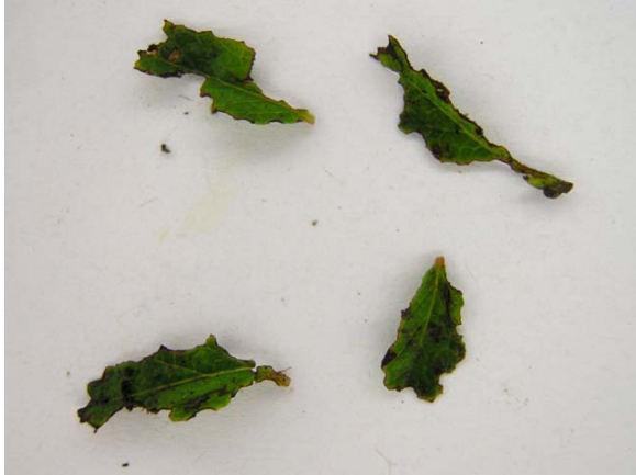
Figure 1a : Marge des feuilles rongées.

L'altise de l'airelle (altise du bleuët) est communément rencontrée dans les bleuëtières du Québec. Les populations, parfois très élevées, peuvent entraîner des pertes de rendement. Celles-ci sont causées principalement par les larves qui se nourrissent surtout du feuillage en développement dans les champs en végétation et, dans une moindre mesure, aux fleurs. Typiquement, les dommages sont situés à la marge des feuilles (figures 1a et 1b). Les adultes se nourrissent aussi des feuilles et des fleurs et peuvent causer des dégâts considérables lorsque les populations sont très élevées.