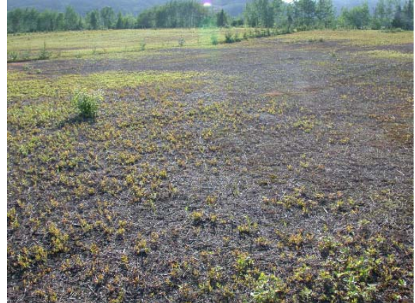
Figure 1b : Dommages au champ.