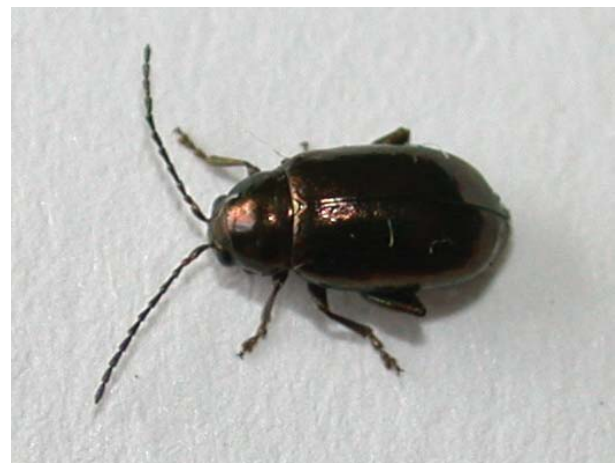
Figure 4 : Altise au stade adulte.