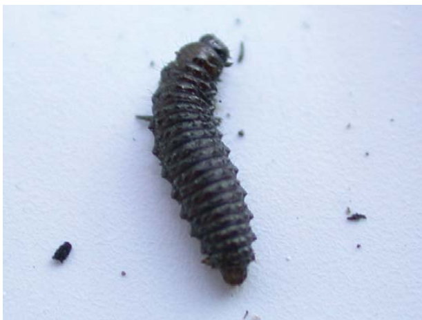
Figure 3 : Larve de l'altise.